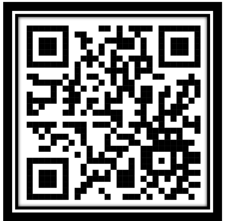
BUKU REGISTRASI ONLINE