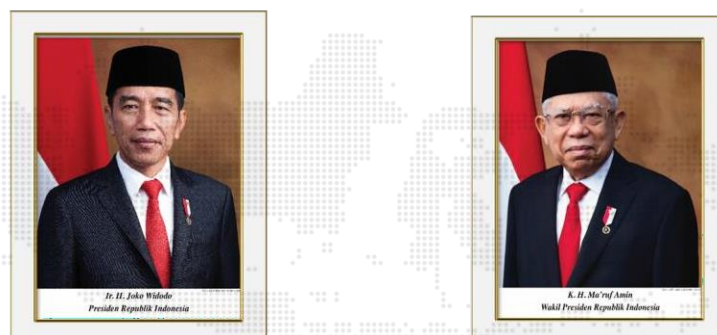
Gambar 4 Presiden dan Wakil Presiden Terpilih pada Pemilu 2019

Meskipun Pemilihan Serentak 2019 yang pertama sekali diselenggarakan diwarnai dengan sengketa Pemilu Pilpres ke Mahkamah Konstitusi, namun banyak kalangan masyarakat, media maupun dunia internasional mengakui