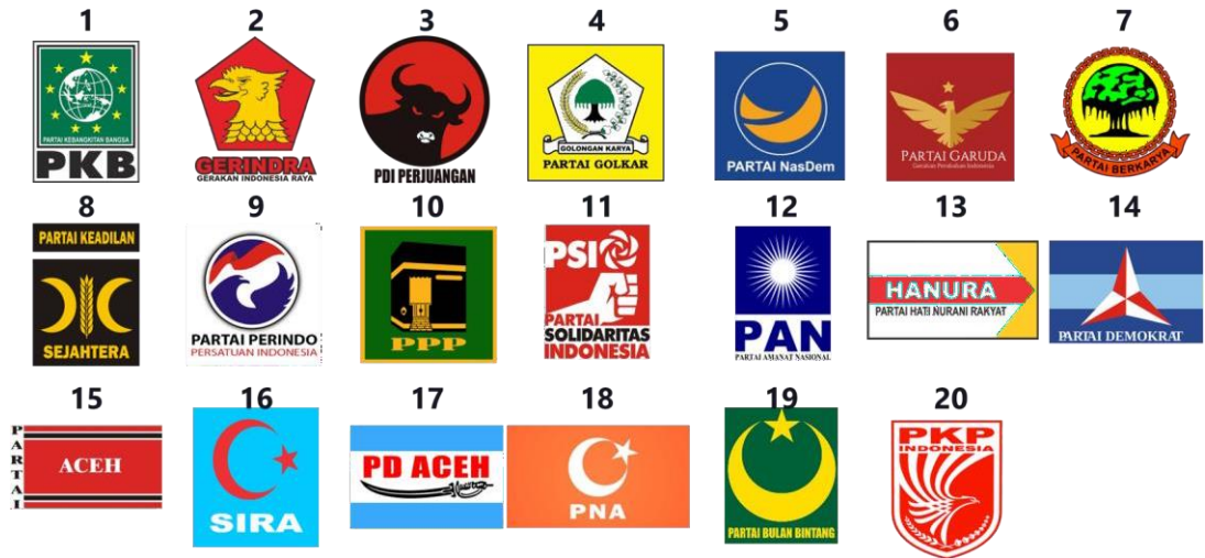
Gambar 3 Partai Politik Peserta Pemilu 2019

Pemilihan Umum Tahun 2019 telah mencatatkan total Daftar Pemilih Tetap Hasil Perbaikan Ketiga sebanyak 948.571 pemilih dengan rincian pemilih laki-laki berjumlah 469.764 pemilih dan pemilih perempuan berjumlah 478.807 pemilih, tersebar di 7 Kecamatan, 54 Kelurahan, dan 3.819 TPS.