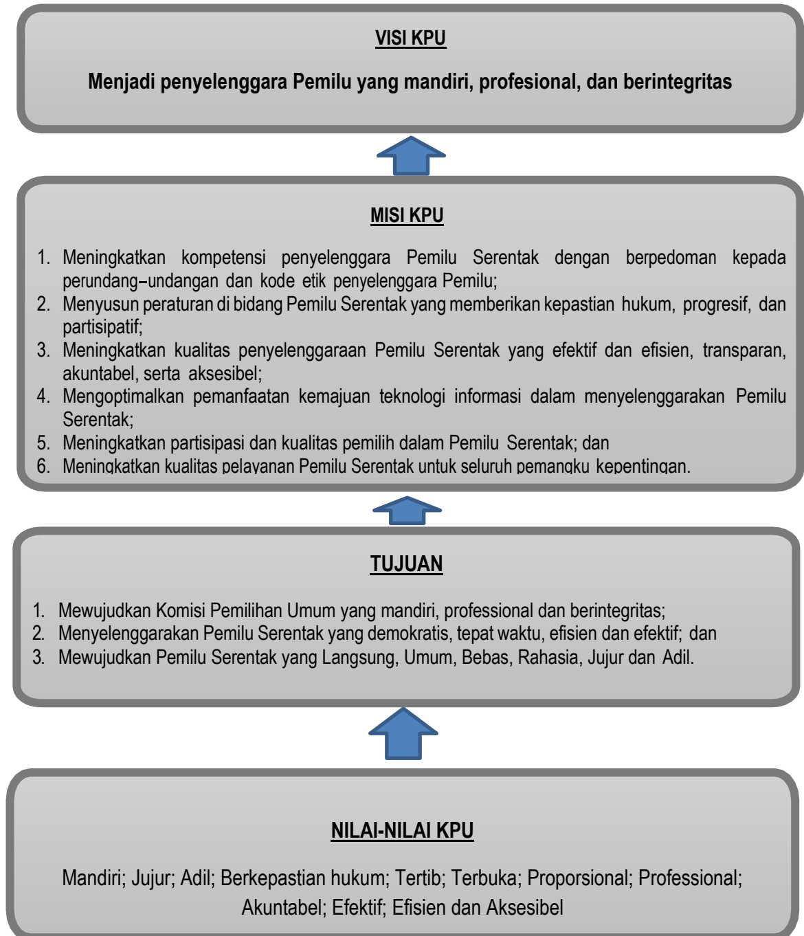
Gambar 5. Keterkaitan antara visi, misi, tujuan dan nilai-nilai KPU

Keterkaitan antara visi, misi, tujuan dan nilai-nilai KPU Kota Tangerang Selatan secara diagramatis dapat dilihat pada gambar 5 berikut ini.